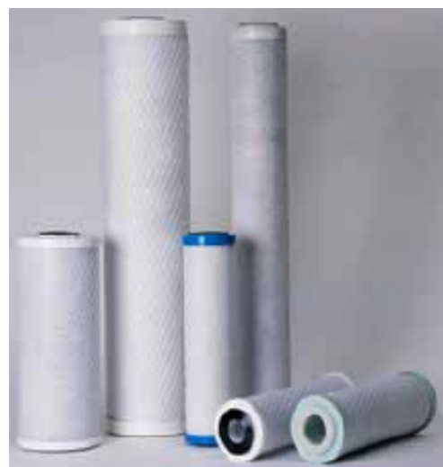
Différentes types de cartouches incluant les cartouches bobinées...