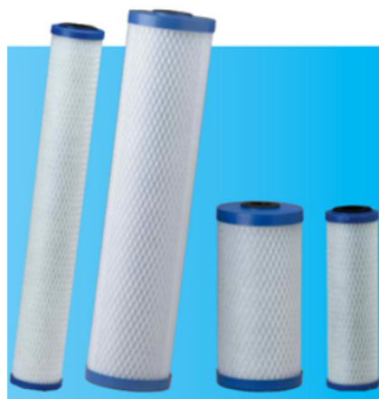
Une gamme complète !