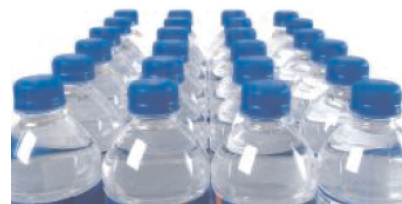
Application : Industries d'Embouteillage