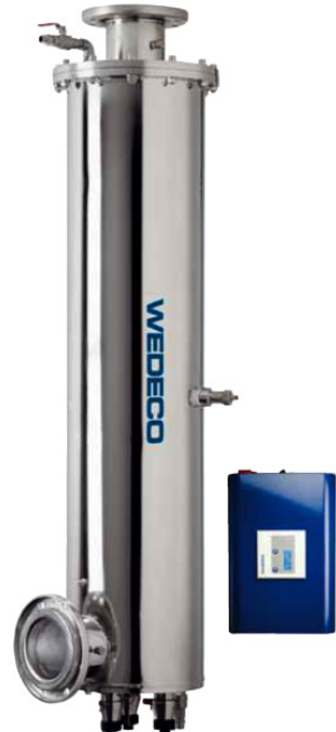
Système de désinfection UV Spektron®