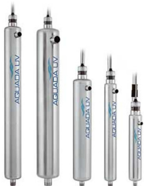
Systeme de désinfection UV Aquada®